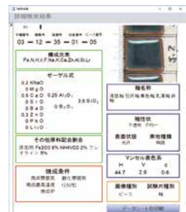
データベースの出力画面

このライブラリーは、国立研究開発法人 産業技術総合研究所 中部センターが長年にわたり釉薬体系毎に蓄積したテストピースとその一部をデジタルデータ化したデータベースを譲り受け整備いたしました。